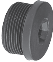
M25 Ex-Blindstopfen M25 Ex-blanking plug