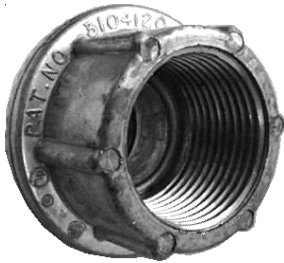
M25 - 3/4" Myer Hub