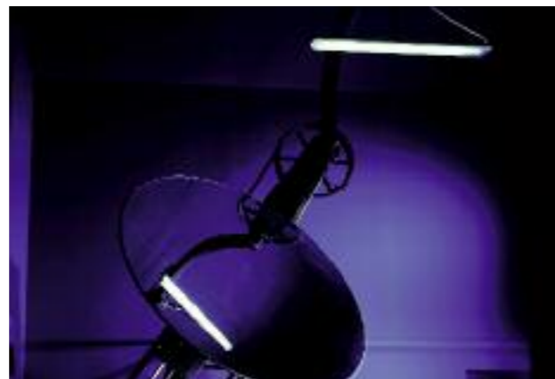
Lichtlabor Laboratoire d'éclairage Lighting Laboratory

leuchten in einer druckwasserdichten Ausführung mit der Gehäuseschutzart IP 68 zur Verfügung.